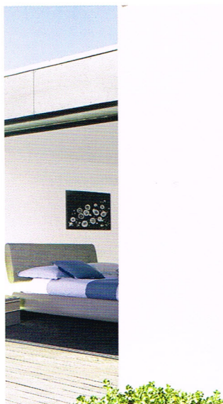
Design intérieur carré