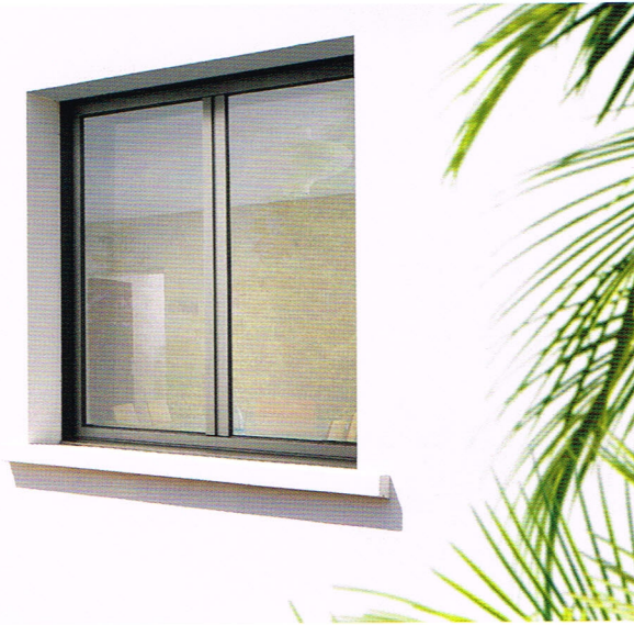
Design intérieur galbé